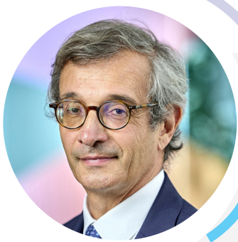
Me Gilles BONNET Président 122 e Congrès des notaires de France